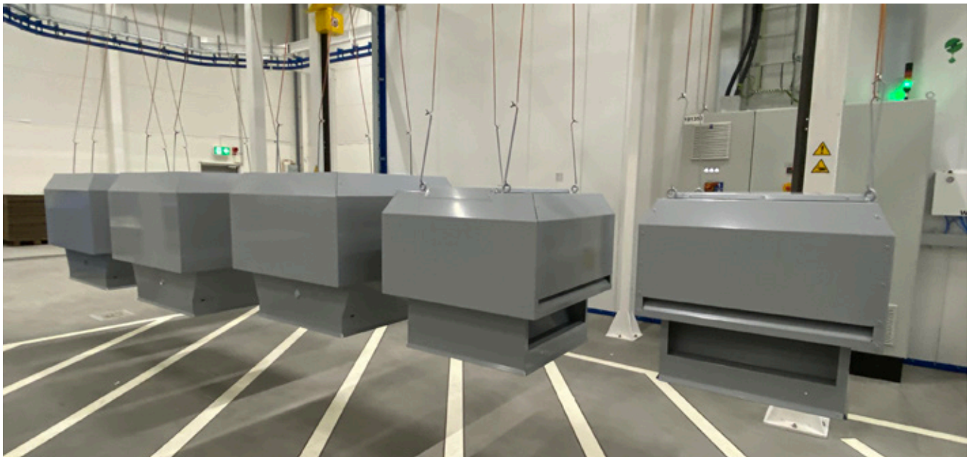
Takhuvar som nyligen pulverlackerats och härdats i vår värmeugn.