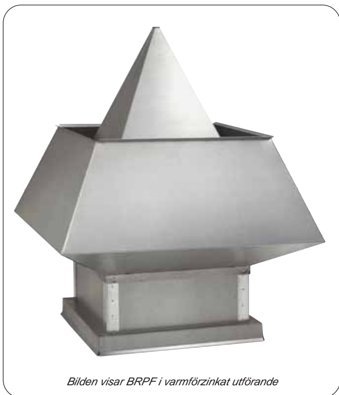
Bilden visar BRPF i varmförzinkat utförande